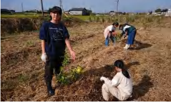
写真左: わらしべについて勉強中、右上: 食事の段取りも自分たちで、右下: 肥料まきと草取り

11月19日から2日間、まちの課題解決・探究コース5期生の合宿が熊日宮原販売センターであった。 【19日】 14:30 買い物～15:00 学習会～17:00 入浴と食事～19:30 学習会～21:30 フリー 【20日】 7:30 起床・朝食～9:00 農作業～11:20 昼食～12:30 ふりかえり～13:30 終了 今月から学習会のテーマが商品開発となり、宮原サービスエリアのお土産を調査した。その後、1人で3つの商品を選び、プレゼンや議論を行っている。 そして合宿では、 ストーリー性 (エピソードや物語性、筋書きが明確など)のある商品が売れやすいことを教えてもらい、以前