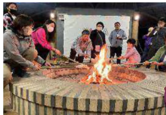
五家荘自然塾で夜カフェを楽しむ参加者

10月22日から2日間、「山ガールサミットin八代」が五家荘をメイン会場に開催され、全国から60人が参加した。1日目は、五家荘自然塾でワークショップ「鹿の角でアウトドアギアを作ろう！」と題し、参加者が鹿の角を使ったランタンハンガーなどを製作。夕食後、参加者の交流を目的に「夜カフェ」が開催され、交流を深めた。2日目は、せんだん轟の滝など3コースを設定し、参加者は希望するコースで、秋の五家荘を満喫した。