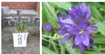
希少野生植物のヤツシロソウ

ヤツシロソウは、夏に桔梗や竜胆に似た花が茎頂や上部葉腋に多数集合して上向きに咲くキキョウ科の多年草である。別名、リンドウザキカンパニユラ(竜胆咲きカンパニユラ)。