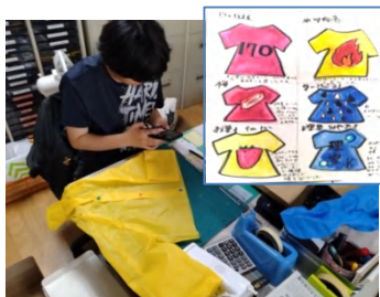
デザイン案をもとに製作中

梅雨の時期となり、小雨の中での作業だったが、私たちの活動に気づき顔を出してくださる方、声をかけてくださる方の笑顔にとても元気づけられた。これからますます雨が増えるとどんよりとした気分になることもあるが、ぎろっちょ石像が着ているレインコートのように、雨のどんよりとした憂鬱を明るく跳ね飛ばして欲しいところ。そしてみなさまに、明るい笑顔が届けられたらいいな、と思っている。