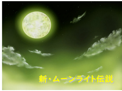
新・ムーンライト伝説

㈱氷川のぎろっちょは耕作放棄地の削減を目標としているが、今回のコンテストでは「子どもは昼間は学校や部活で忙しいが、月や星を見るのが大好きで、夜に外へ出るとワクワクする！」というのがアイデアのはじまり。 満月を含む1週間の間に90分程度の農作業を行うことで、以下の5つの課題解決を目指す。