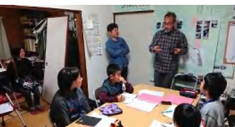
全国の話たくさん聞いて楽しかった