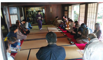
菅原道真ゆかりの左座家屋敷で茶会

10月27日から11月30日まで、五家 荘一帯で開催されていた「五家荘紅 葉祭」が終了した。今年も紅く染ま った山々の紅葉狩りを楽しみに、多く の観光客が訪れた。 今年は五家荘紅葉祭の周知を目的 に、10月下旬にJR八代駅構内 で紅葉祭オープニングPRイベントが 開催された。 また、祭り期間中、五家荘地域振 興会主催のイベントも行われ、五家 荘一帯が賑わいをみせた。