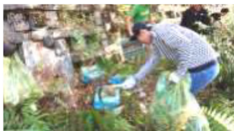
清掃作業を行うクライマー

空き缶や、流れ着いたペットボトルな どのゴミが散乱している。そこで、日 頃ボルダリングを楽しんでいる有志 が集い、感謝の気持ちを込めて実施 した。